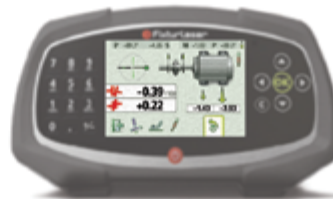
Регулировка по горизонтали